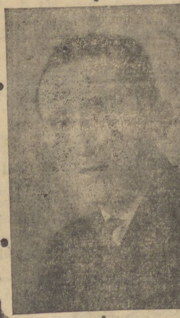
samente se associa.

certamente, ver-se-há cerca-do de grandiosas manifestações de apreço ás quaes, "Diario dos Campos", gosto-