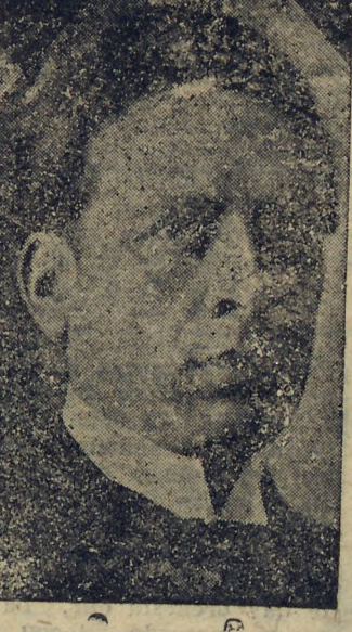
GEN. FOLRES DA CUNHA

PORTO ALEGRE, 5 (D) — Os vespertinos desta capital