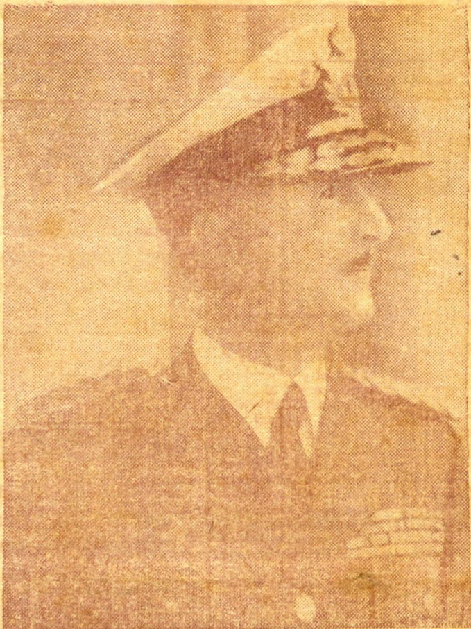
O 1º ministro da Iugoslavia, g. al. Simovitch, que acaba de organizar em Londres o "governo de exilio" de seu país, composto de um servo, um esloveno e um croata.

BEIRUT, 22 (T. O.) — Foi informado que os australianos se achavam, esta manhã, a mais de 13 quilômetros ao sul de Beirut. As informações locais desmentem que esta cidade tenha sido evacuada pelos franceses e que os britânicos ocuparam a cidade. As forças de Vichy continuam resistindo ao norte de Damasco, enquanto que os britânicos, consolidam as suas posições neste ponto.