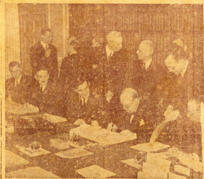
UMA FOTOGRAFIA HISTORICA — O sr. Winston Churchill assina a mensagem que enviou ao sr. Roosevelt por intermedio do embaixador Winant.

LONDRES, 22 (Reuter) — O Primeiro Ministro Churchill em seu discurso de hoje faz um evidente apelo aos Estados Unidos quando diz: "Si a invasão da Russia não é outra coisa que o preludio de uma tentativa de invasão contra as Ilhas Britanicas, sem duvida tem tambem a finalidade de apressar-se nessa conquista para que não lhe venham en-