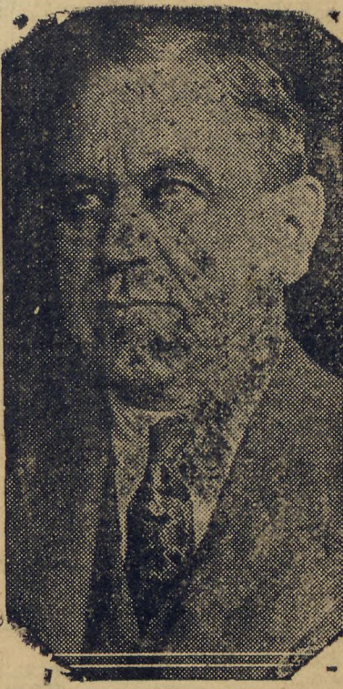
MANOEL RIBAS, eleito hon-tem governador do Paraná

Para ordem do dia de amanhã, da Assembléa Constituinte, consta a eleição dos membros da commissão que vae elaborar o regimento interno, bem como a eleição complementar da mesa.