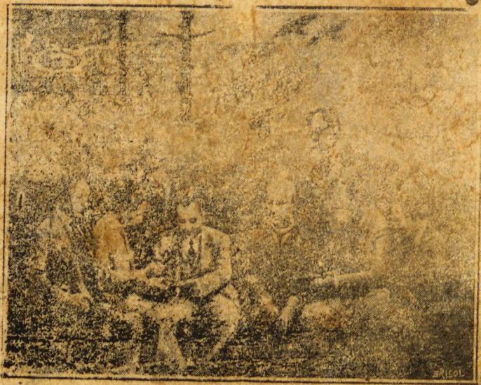
Flegante de quando estava em sendo lidas as linhas da mão do sr. Getulio Vargas pelo illustre chirosopho e seu irmão