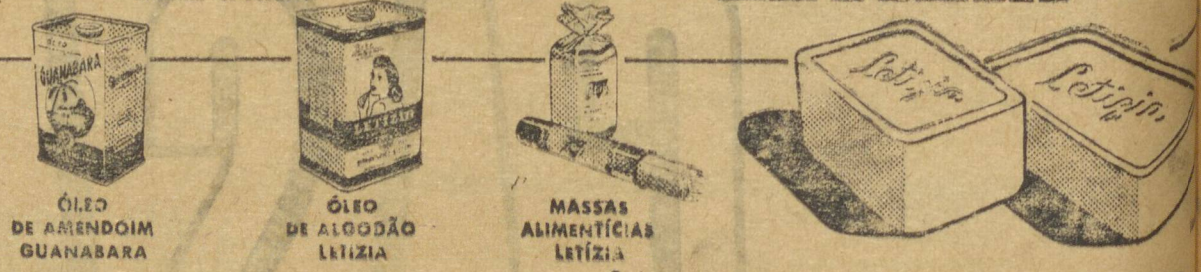
ÓLEO DE AMENDOIM GUANABARA