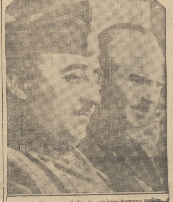
O general Franco, ao lado do ministro Serrano Suñer

Tambem suspensa a visita da Missão Militar