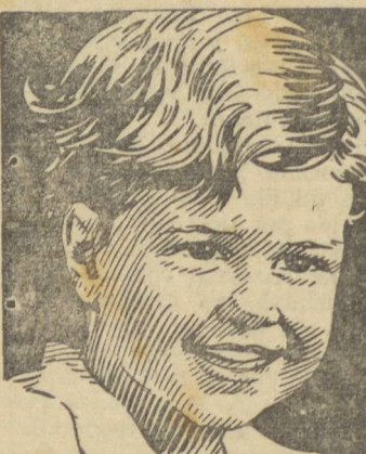
A saúde de seu filho