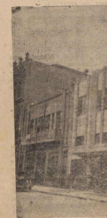
FREDE RICO LANGE & CIA. LTDA. RUA 15 DE NOVEMBRO Nº 33 e 35 — CAIXA POSTAL A GROSSA. — PARANÁ. CO: "FRELANGE". — PONTA GROSSA. — END. TELEGRÁFICO: "FRELANGE".

Segundo uma comunicação do Departamento Juvenil do Guarani, as inscrições para o referido certame atlético encerrar-se-ão no próximo dia 10, amanhã, devendo os interessados procurarem com a máxima brevidade o Presidente do Centro Greenhalgh afim de fazerem as suas inscrições.