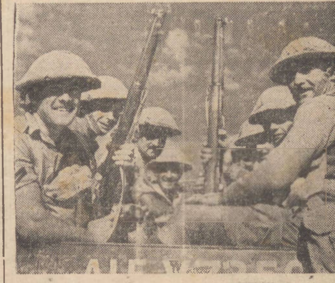
FAMOSOS REGIMENTOS INGLEZES SUBSTITUEM OS AUSTRALIANOS EM TOBRUK — Durante um periodo de varios meses, a IX Divisão Australiana foi retirada da Libia e enviada como reforço para a guarnição da Península malaia onde as tropas imperiais procuravam tomar posição ante a iminência de um ataque pelo Japão. Assim as posições desses soldados austríacos, em Tobruk, foram entregues a guarda de varios dos mais famosos regimentos do exercito britânico. A gravura acima nos mostra justamente um grupo de soldados de um desses regimentos, na ocasião em que se guilam para as suas novas posições de Tobruk.