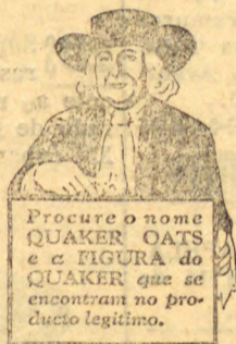
Procure o nome QUAKER OATS e a FIGURA do QUAKER que se encontra no pro- ducto legitimo.

O Quaker Oats tem um sabor delicioso. Agora que se pode cozer em 2 1/2 minutos, deve ser servido com mais frequencia, não só na refeição matinal, mas também ás ou- tras refeições. Presta-se para engrossar sopas, para biscoitos, frituras e outros pratos deliciosos.