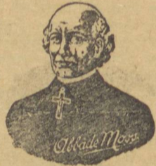
Pilulas do Abbade Moss

As Pilulas do Abbade Moss, formuladas exclusivamente para combater as molestias do figado, estomago intestinos, fazem desaparecer em pouco tempo o mal estad do figado, a dispepsia e a prisão de ventre.