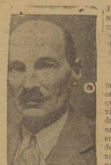
PRIMEIRO MINISTRO CLEMENT ATTLEE

LONDRES, 29 (R) — O Primeiro Ministro Attlee anunciou esta noite importantes mudanças no gabinete britânico, incluindo a nomeação de sir Stafford Cripps para o Ministério dos Assuntos Economicos.