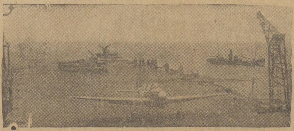
EM ALTO MAR — Um “Spitfire” britânico levanta vôo de um porta-aviões, para ir em perseguição dos bombardeiros nazistas que se aproximam de um comboio aliado.

Yelia. No setor de Karkov, onde milhares de soldados alemães