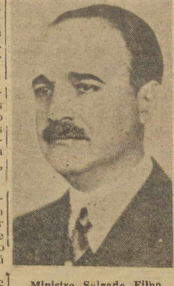
Ministro Salgado Filho

RIO, 27 (A.N.) — Afim de inspecionar a fábrica de motores, embarca amanhã para Minas o ministro Salgado Filho.