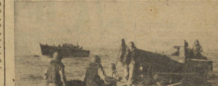
Submarino alemão destruído por forças aliadas.

panhados por bombardeiros "Lightning", descarregaram 151 toneladas de bombas sobre Rabaul e puzeram fora de ação cerca de 30 aparelhos inimigos que se encontravam no aeródromo. Durante a ação de segunda-feira foi igualmente atacado o aeródromo de Lakunai, situado a 21/2 quilômetros a sudoeste de Rabaul.