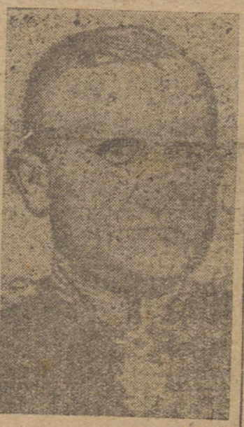
Ministro Gaspar Dutra grandiosa cerimonia da entrega do labar sagrado ao 13.º R. I. Cordiais saudações.

(a) Eurico Gaspar Dutra, Ministro da Guerra".