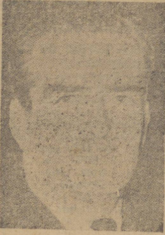
SR. ANTHONY EDEN

Outra importante declaração fez o ministro Eden, ao confirmar que também o Governo britânico não fora consultado pela Rússia, para o reatamento das suas relações com a Itália. Disse a propósito o titular britânico: — “O Governo britânico já se comunicou com o da Rússia a respeito da troca de representantes diplomáticos com a Itália,