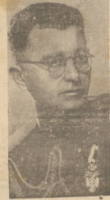
O Gal. Mishailovitch, o bravo chefe dos guerrilheiros iugoslavos

LONDRES, 5 (U.P.) — Uramente as forças do "eixo" na zona de Kraya, na Bosnia, matando mais de mil e quatrocentos soldados e oficiais totalitários, e ferindo outros seiscentos.