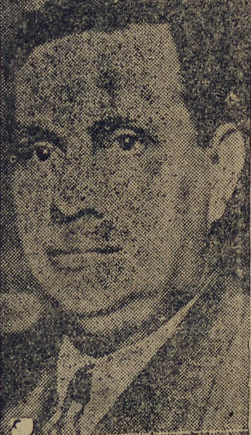
GENERAL GÓES MONTEIRO

tram annualmente no nosso país para subvencionar esse diabolico serviço. De boa fonte sei eu que, através de uma Republica vizinha, entraram num só mez, em 1934, 6.000$000 para esse fim! Não estão em foco, propriamente, nem o comunismo, nem o nazismo ou o fascismo, ou ainda qualquer outra forma ou ideologia de governo! Tampouco o interesse dos "comités" estrangeiros nao reside em nos catechizar para este ou aquelle credo politico: o interesse está somente em perturbar, confundir, anarchizar a nossa vida, para que ofereçamos menor, pouca ou nenhuma resistencia ás suas ambições.