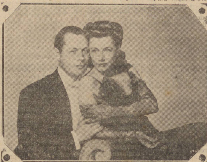
IRENE DUNNE e ROBERT MONTGOMERY em:

... em seu rosto reflete-se a seriedade de animo alimentada por um sentimento de gratidão e estima que dedica ao homem que lhe deu seu nome, que a ampara e que a respeita! No entanto, em seu coração esconde-se um romance de tumultuante alegria cujo protagonista é um "outro" da sua inesquecivel "DELICIOSA AVENTURA".