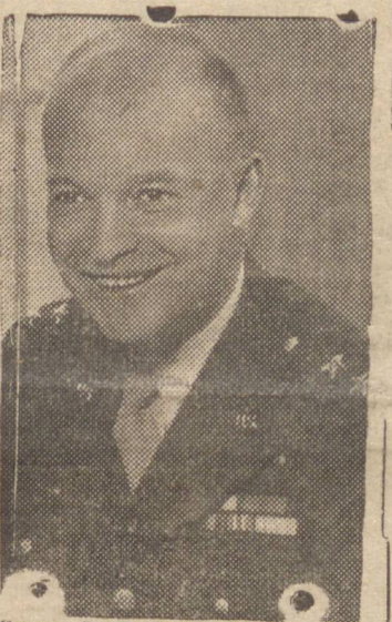
General Dwight Eisenhower, comandante em chefe das forças norte americanas na do Norte

LONDRES, 28 (U.P.) — URGENTE. — Foi nomeado alto comissário do território da África Setentrional Francesa, o general Henry Giraud.