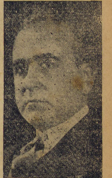
Sr. Getulio Vargas

DISTURBIOS EM ITAJUBA' RIO, 2 (D) — A proposito dos acontecimentos occorri-