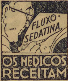
OS MEDICOS RECEITAM LUXO-SEPATINA

Regulariza as suspensões. Corta as grandes hemor- rias. Combate as Flores Brancas. Evita o Rheu- matismo e os tumores na idade critica. E' poderoso calmante a Regulador dos Partos, evita Dô- res, Hemorragias e quasi nulli- fica os accidentes de morte, que que são de 1 por cento. Meni- nas de 13 a 15 annos, todas de- vem usar o FLUXO-SEDATINA. que se vende em todo o Brasil, Receitada por 10.000 medicos LUXO-SEPATINA encontra-se em toda a parte