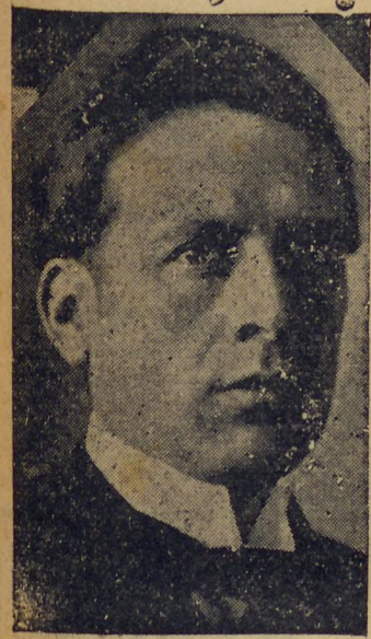
General Flores da Cunha

RIO, 2 (D) — A politica geral está de tal forma complicada, que só mesmo os iniciados podem decifral-a. Se a politica,ha, domestica, nos Estados, é de molde a infiltrar confusão nos espiritos mais esclarecidos, a do governo central, que se processa nas confabulações collectivas do ministério, não foge a essa regra — unica que não conhece excepção. O certo é que fia, real-