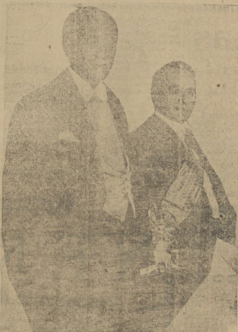
Drs. Getúlio Vargas e Antonio Carlos

O vôo é baixo, mas num ensaio para as alturas!