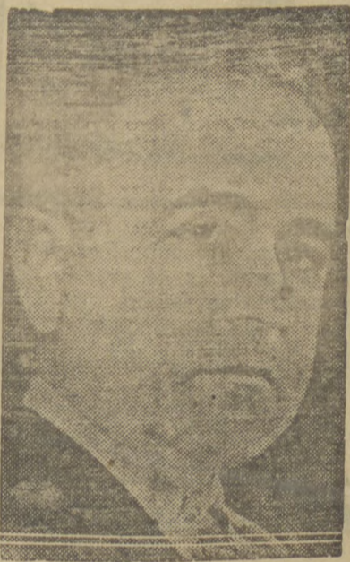
Dr. Getulio Vargas

Buenos Ayres, 23 (D.). O sr. Getulio Vargas, acompanhado pelos membros destacados de sua comitiva, chegou a esta cidade á rua, o presidente brasileiro era vivamente aclamado pela multidão que se reuniu para receber o sr. Vargas.