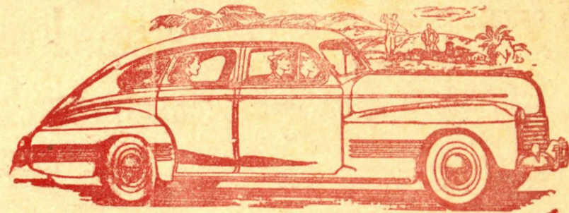
Acima ilustramos um Sport Sedan De Luxe

Todos sentimos os prenúncios de uma era suntuosa que colocará o Brasil no apogeu da civilização humana. Esse prodigioso presentimento nos obriga a trabalhar desceparadamente para ganharmos o tempo perdido que vivimos a discutir sobre política de partidos ou partidos da política. Os brasileiros estão mobilizados para o trabalho. E com o nosso trabalho solidificamos a obra do Estado Novo, que quer dizer Nação Forte, de soberania plena, que precisa estar espiritualmente preparada para não temer arreganhos de quem quer que seja.