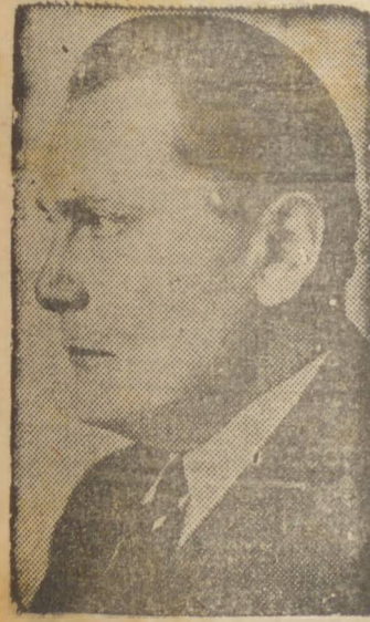
MAJORAL GOERING GOERING, CREADOR E CHEFE DA "LUFTWAFFE", QUE, SEGUNDO TELEGRAMA POR NÓS PUBLICADO, SERÁ OU FOI ALCANÇADO PEA DEPUAÇÃO

CONFIRMADO UM "FURO" TELEGRAFICO DO "DIARIO DOS CAMPOS", ANUNCIANDO O DESMANTELAMENTO DO EXERCITO ALEMÃO. — MUITO CRITICA A SITUAÇÃO DAS TROPAS NAZISTAS EM BRIANSKI — CONVOCADOS NOVOS E CONSIDERAVEIS CONTINGENTES NA ALEMANHA PARA PREENCHER OS GRANDES CLAROS