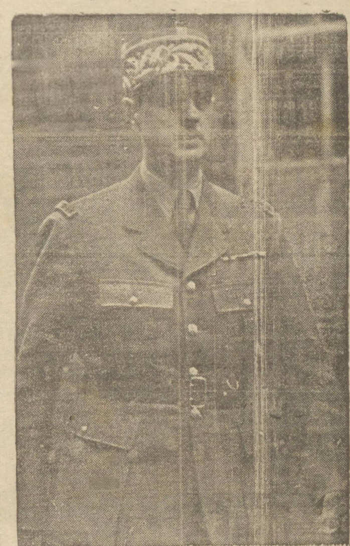
GENERAL DE GAULLE

LONDRES, 13 (U.P.) — O general De Gaulle declarou que nove governos no desterro demonstraram a firme intenção dos aliados de impedir que os culpados, sejam quais forem as suas nacionalidades, fujam ao castigo que merecem como ocorreu na passada guerra mundial.