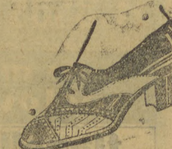
10035 — Extra phantasia em naco marron e Havana salto mexicano 3 centimetros