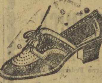
10040 — Modelo em branco e marron, gaspia toda picotada em naco marron e branco, salto 3 centimetros.

Calçado sob medida Vendas só a dinheiro Avenida Vicente Machado 64