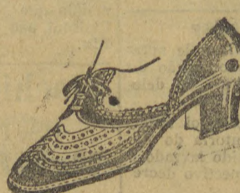
10038 — Interessante modelo em naco beje e azul, salto mexicano 3 cc. Temos este modelo em salto de sola 3 centimetros.