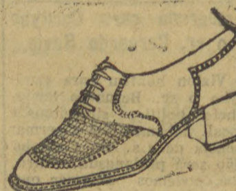
6030 — Modelo em salto mexicano, 3 centimetros, em naco beje e gaspia toda trançada