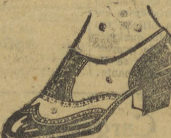
8117 — Typo esporte, material resistente, todo em naco marron, proprio para uso diario, salto de sola 3 centimetros. Temos este typo em calçado real “BOCHA”