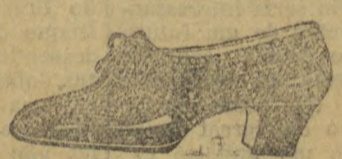
Referencia 177, modelo Napolitano — PARA O INVERNO, forma e salto mexicano, 3 e 4 centimetros de 32 a 40. Em superior naco cor de vinho, marron, rosa beje 23$

Especialista em calçados finos e duraveis