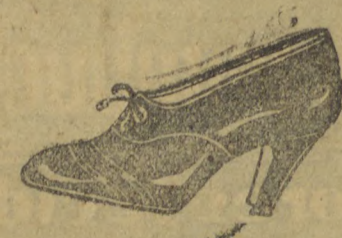
Referencia em calçado Luis XV, modelo napolitano, para inverno, salto 4, 5 e 5 1/2c. Em superior pellica envernizada preta ou boscal preto ou cor de vinho, de 32 a 40 ..... 33$