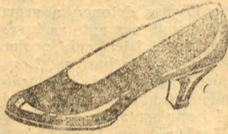
Offerta especial: Superior pellica preta envernizada, forrado de branco. Salto Luiz XV cubano alto e 4 de altura, de 32 a 40... 28$090