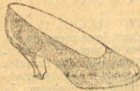
Raso em verniz preto. Todo picotado e forrado de branco. Salto Luiz XV. Mesmo modelo em pellica preta finissima... 30$000