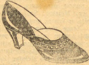
Superior verniz preto, raso, moderno, com picote ao redor da gasnia; forrado de branco. Salto Luiz XV cubano, alto, 32 a 40... 29$000

Calçados mexicanos Em todas as cores 20% menos do que em qualquer outra casa