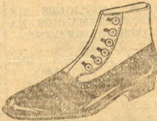
ROCHA (Referencia 4301). Em verniz preto, artigo finissimo para passeios e soirées