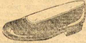
Superior, verniz preto forrado de branco, salto de sola baixo, bom acabamento; de 32 a 40... 19$000