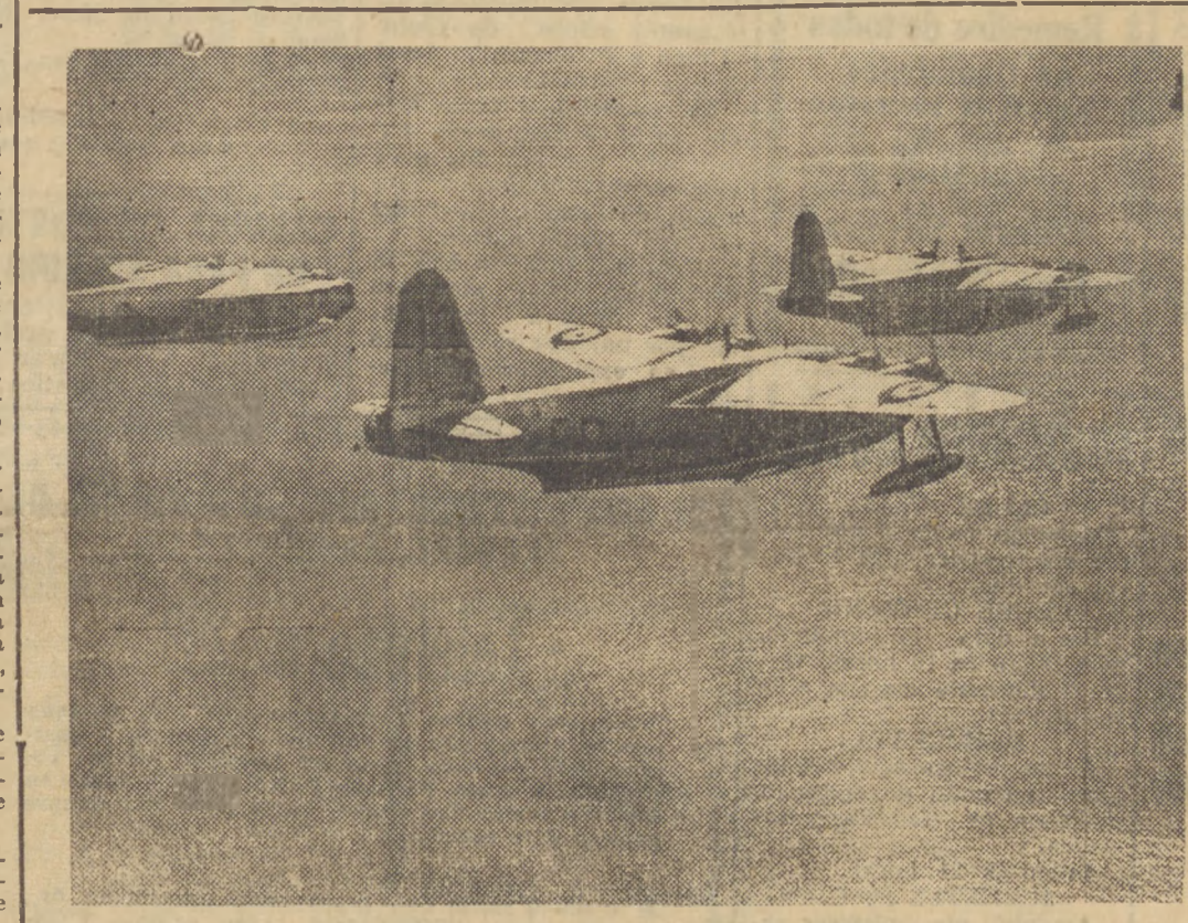
UMA ESQUADRILHA DE BOMBARDEIO ALIADA OPERANDO NO MAR DO NORTE