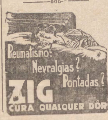
Reumatismo? Neuralgias? Pontadas? ZIG CURA QUALQUER DOR