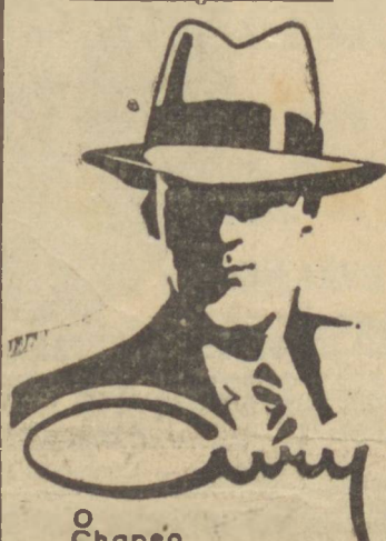
Do Chapeo dos Quarenta milhões! Unicos distribuidores em Guarapuava: "BASAR GUARAPUAVA" o maior varejista da praça.