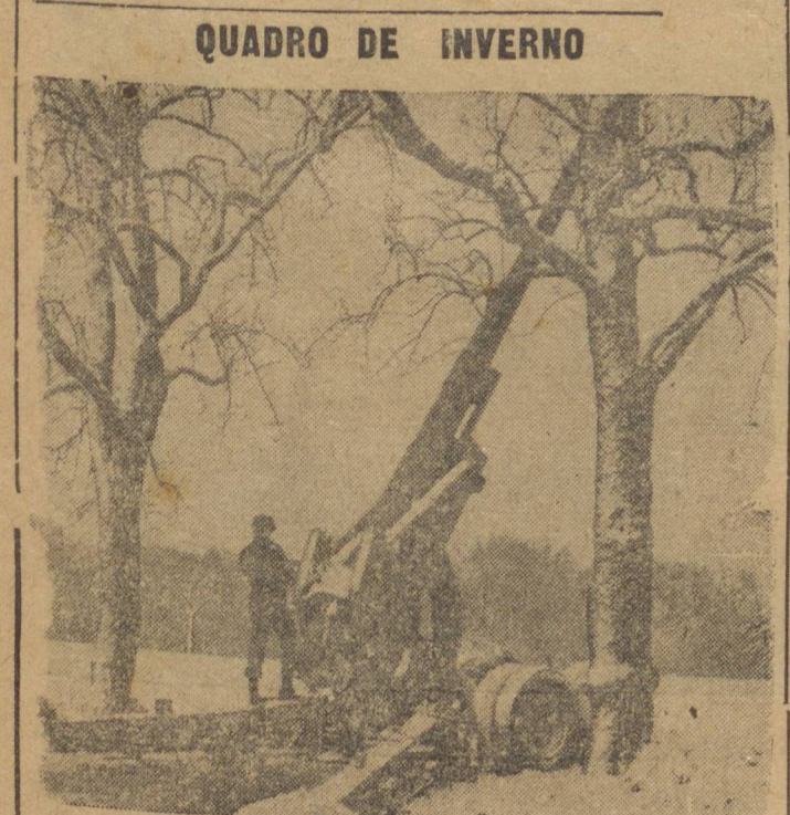
Artilheiro de um canhão norte-americano de 15.50 mm. na frente ocidental. As pesadas nevascas interromperam as observações aéreas naquela frente durante a grande batalha contra os alemães.

PROCUREM para as suas cartas - Transportes Metropolitan Limited - Rua Benjamin Constant, 121 - Fone 588