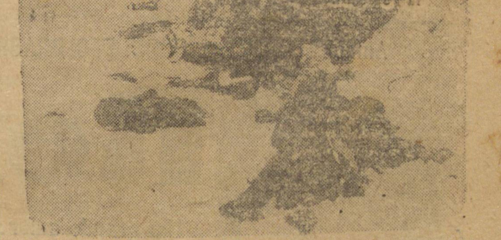
Os mortos alemães que estão numa cratera de neve foram abatidos quando tentavam romper as linhas norte americanas na Frente Ocidental.

Façamos desse comício que se aproxima a maior profissão de fé patriótica já havida em todos os tempos na Capital Civil da do Paraná!