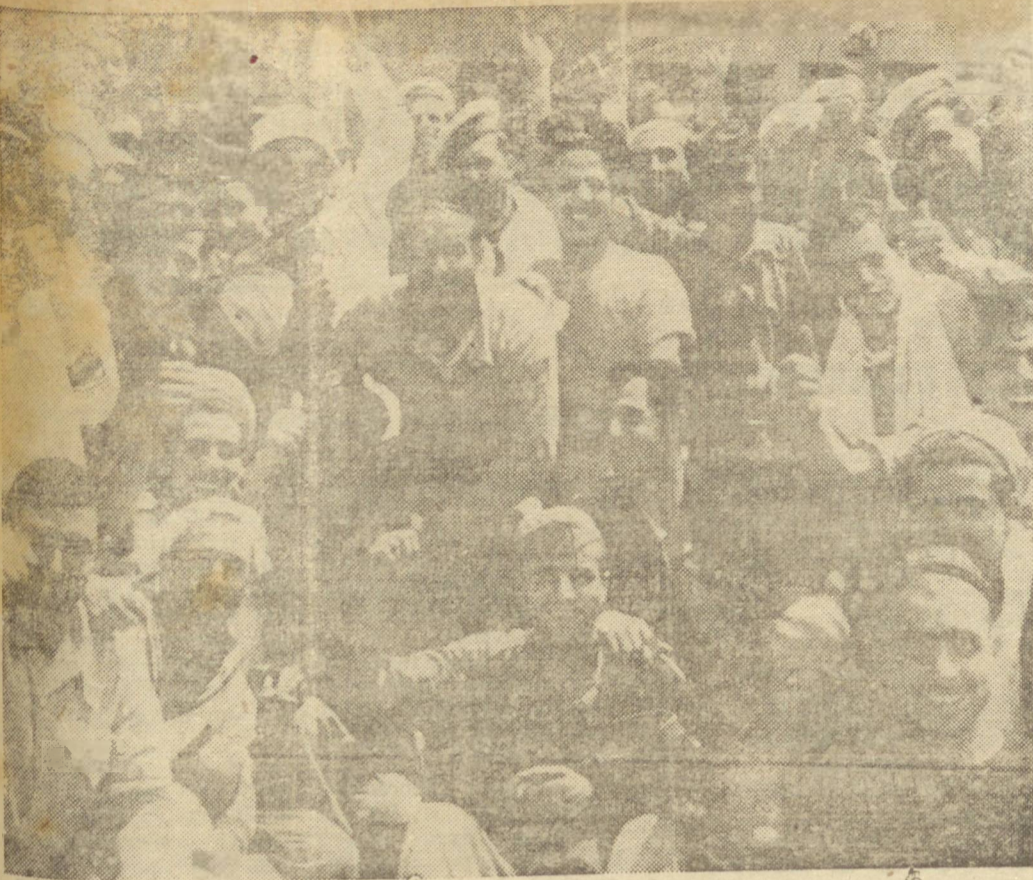
NEGOCIAÇÕES secretas, anuncia uma agência telegráfica, estariam sendo processadas para a capitulação da Itália, a qual é possível seja anunciada de uma hora para outra. O clichê mostra um grupo de prisioneiros italianos feito recentemente pelos Exércitos Aliados. A demonstração do fregio que ostentam, por serem terminados para eles uma guerra que se aproveita do imperialismo germanico, bem revela a alegria que se apoderará dos italianos operários quando, depois de verem a queda do fascismo, puderem deixar de lutar em favor do nazismo.