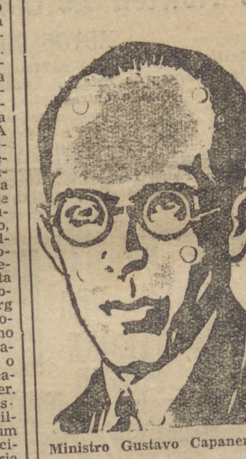
Ministro Gustavo Capanema

pectiva verificação previa. Essas instruções vigorarão apenas para os reconhecimentos processos de 1939, ficando o C. N. de E. nos de cada caso concreto, autorizado a dispensar parte das exigencias estabelecidas para o reconhecimento official dos referidos cursos, todas as vezes em que, não havendo na localidade, em numero sufficiente outros estabelecimentos preenchendo as con-