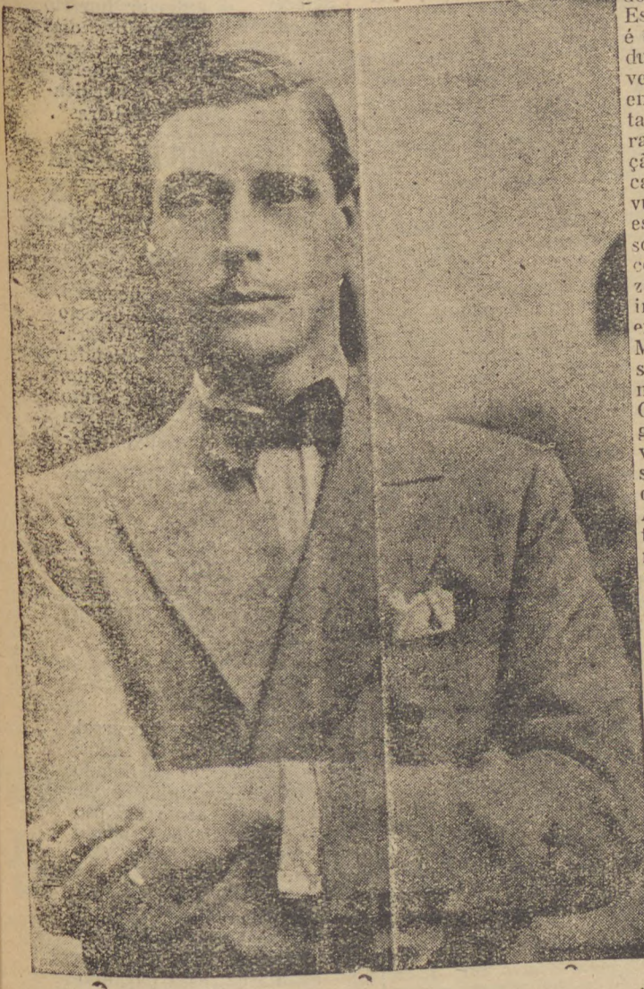
DUQUE DE WINDSOR

"Os estadistas que se dedicarem á restauração da segurança internacional devem agir como bons cidadãos do mundo e não apenas no caracter de bons francezes, italianos, allemaes, americanos ou britannicos — diz o Duque de Windsor