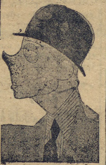
Príncipe de Gales

valor, declarou, com "humor", que compensava tal