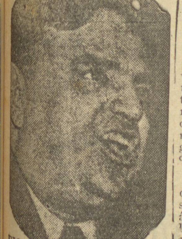
FIORIELLO LA GUARDIA

GENEVA, 11 (U. P.) — O diretor da "U. R. R. A.", sr. Fiorello La Guardia, acusou a União Soviética, hoje, de se apossar do petróleo bruto austriaco e vendê-lo à Tchecoslováquia.