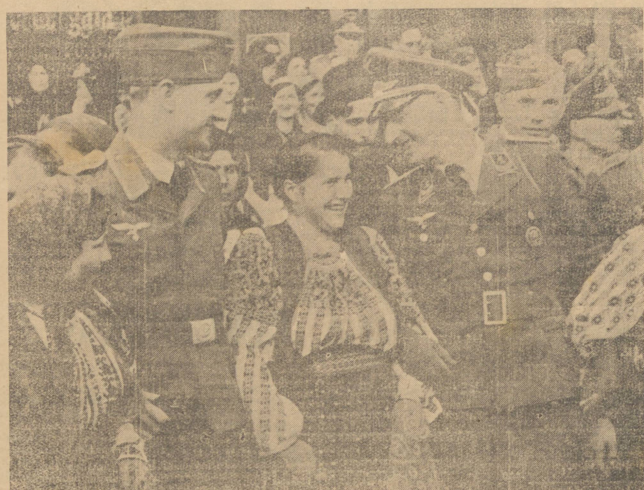
O CLICHE' MOSTRA SOLDADOS GERMANICOS ENTEE A POPULAÇÃO RUMENA, POR OCASIAO DE UMA FESTA POPULAR NAQUELE PAIZ.