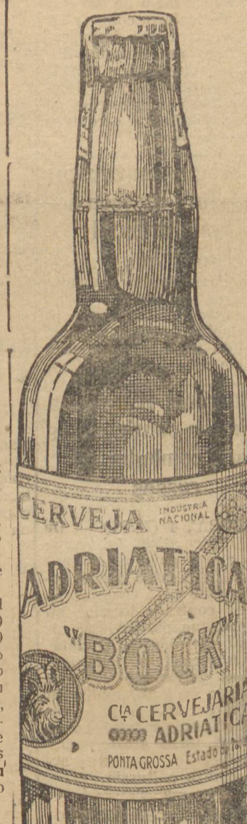
Adriatica Bock Clara e escura