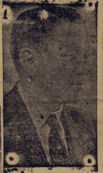
O sr. Manoel Ribas, que não é tão máu politico como se pensa

Como accentua o jovem deputado Brasil Pinheiro Machado, são apenas escaramuças em torno do Governo. Todos insinuam, todos palpitam, todos julgam conhecer a vontade do Governador.