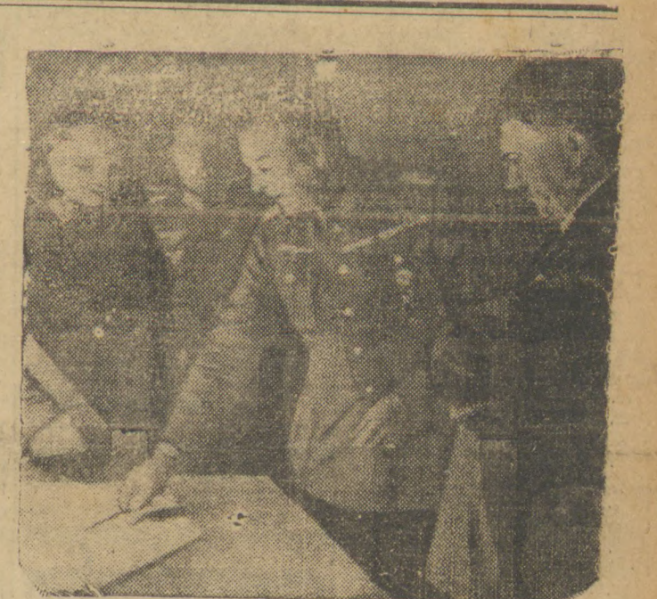
De braços cruzados, o sr. Adolf Hitler assiste a uma discussão entre membros do Alto Comando Alemão, que examinam a situação militar "em certo ponto" da frente ocidental. A contar da esquerda: o marechal de campo Hermann Goerin, o general Wilhelm Keitel e o chanceler Hitler.

Junta pecial para ordenar as compras no EE. UU. LONDRES, 7 (S. P., agencia inglesa) — Foi hoje oficialmente anuado que será criada uma Junta Britânica de Abastecimento no Canadá e nos Estados Unidos, afim de coordenar compras de material belico serem feitas nos Estados Unidos.