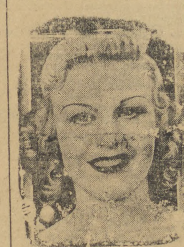
Ginger Rogers e Douglas Fairbanks Jr. no luxuoso e lindo drama da R. K. O.