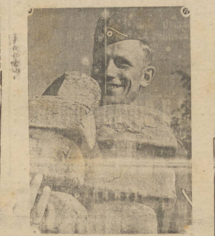
As provisões de boes para o exercito alemão que se acha em combate no paiz inimigo, são de suma importancia. A gravura apresenta um soldado germano carregando quantidade de pão.

Os alemães estão preparados para enfrentar o "gal inverno" São perigos os sapateiros alemães