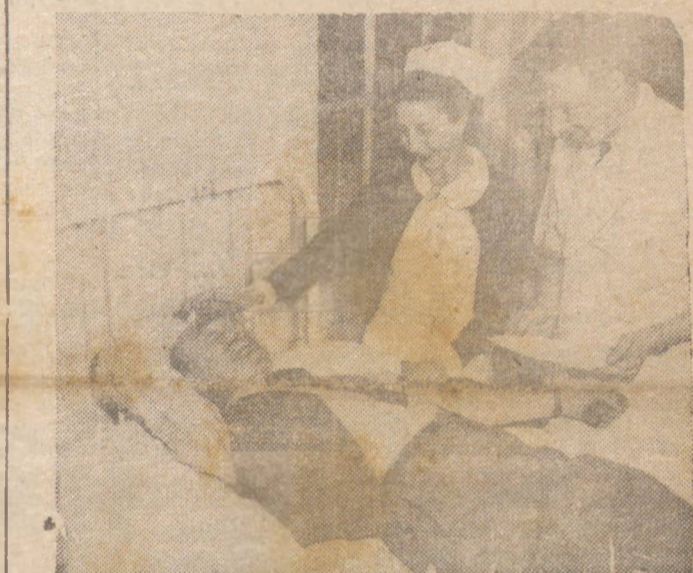
NA FRENTE INTERNA — Todas as camadas sociais dos Estados Unidos atendem ao apelo da Cruz Vermelha. Na fotografia vemos o Procurador Geral dos Estados Unidos Francis Biddle, oferecendo seu sangue para aquela benemerita instituição, contribuindo desta forma para a salvação de milhares de feridos nos campos de batalha.

Guardando o grande dia santificado de hoje, DIÁRIO DOS CAMPOS manterá fechadas suas redações e oficinas, não circulando, portanto, amanhã.