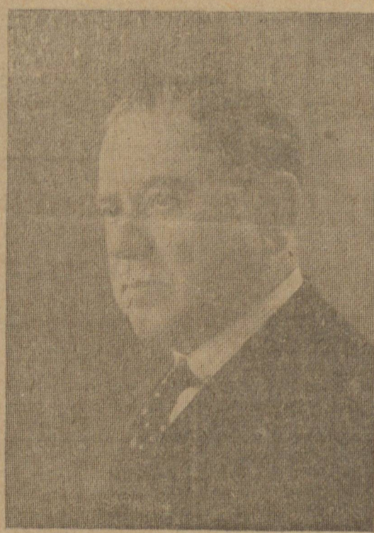
INTERVENTOR MANOEL RIBAS

A cerimônia foi iniciada pela PR-B2, tendo sido igualmente filmada pelo DEIP. O clássico Manoel Ribas, disputado ontem, foi vencido com relativa facilidade