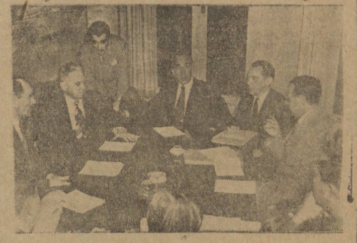
O MINISTRO JOÃO ALBERTO PRESIDINDO UMA REUNIAO

RIO, 3 (A. N.) — O ministro João Alberto embarcou em avião especial das Forças Aereas Brasileiras para a semana seguinte a Semana San- rumo à região do Rio