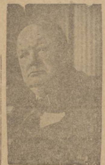
travada na Tunísia ainda não chegou ao seu ponto culminante e por esse motivo deverá aumentar ainda mais de encarecimento declarou na Câmara dos Comuns o primeiro ministro, sr. Churchill. Admitiu, porém que os alemães resistem energeticamente e mediante vigorosos contra-ataques, conseguiram repôr, em grande parte, a cunha introduzida na Linha Mareth pelo 8.º Exército Imperial Britânico.

LONDRES, 24 (U. P.) — "A intensa batalha que está sendo