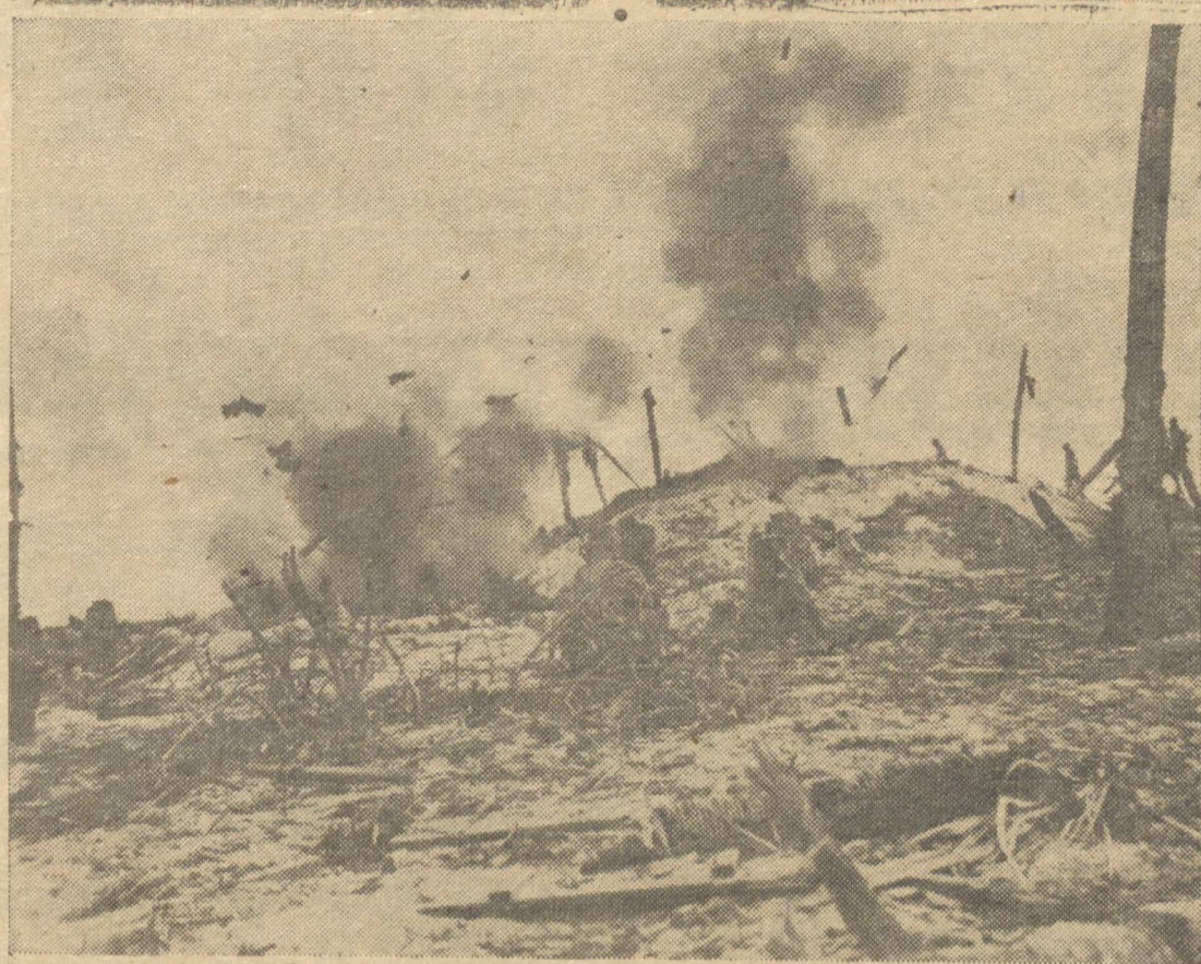
Trava-se em Cassino uma das batalhas mais complexas desta guerra, em torno da qual estamos inserindo, hoje, interessante comentário que nos foi transmitido pela "United Press", de modo a elucidar o espírito dos leitores. No clichê acima encontramos uma visão da luta em Cassino — a cidade devastada, completamente arrasada, transformada num verdadeiro "inferno de fogo, fumaça e escombros".