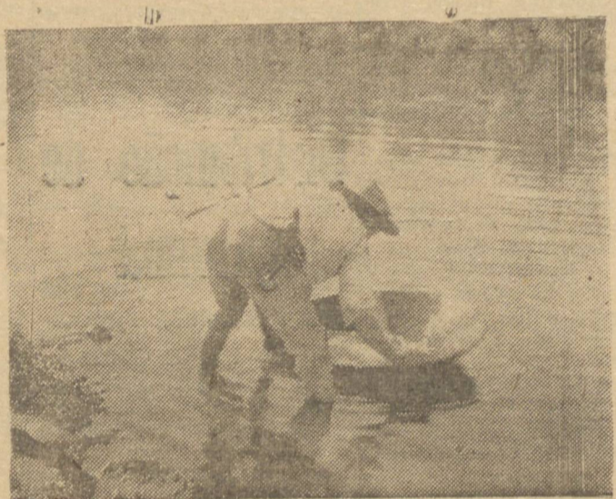
UMA CENA DA GARIMPAGEM EM NO TIBAGI: GARIMPEIRO BATIANDO

Uma informação sensacional foi trazida, ontem, á nossa reportagem, ou seja, o encontro, por um garimpeiro, de uma pedra de diamante que conseguiu a maior valorização de quantas já foram achadas nos últimos anos.