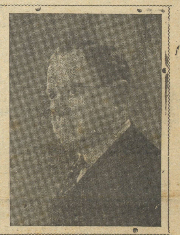
Sr. Manoel Ribas