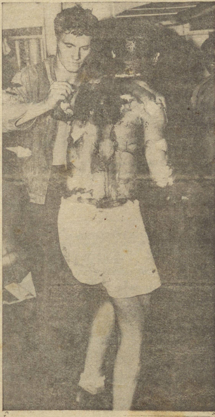
UM MARINHEIRO NORTE-AMERICANO COM AS COSTAS CHEIAS DE SANGUE COBERTAS DE QUEIMADURAS LEVANTA ANGUSTIOSAMENTE OS PÉS PARA RESISTIR AOS DOLOROSOS PRIMEIROS SOCORROS DADOS A BORDO DE UM NAVIO DE GUERRA AVARIADO DURANTE A BATALHA.