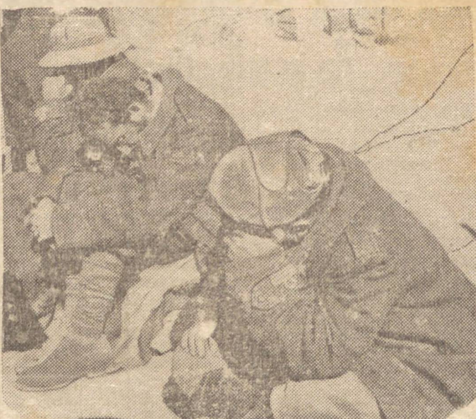
AS VITÓRIAS BRITÂNICAS NA LÍBIA. — 31.000 PRISONEIROS DO EIXO. — A rendição incondicional de Italfaya, um dos pontos fortes das defesas do Eixo na zona do deserto ocidental, marcou o fim das atividades nazifascistas nessa área, restando ao general Rommel tão somente a sua posição de El Aghella. Em dois meses exatos de luta, as forças imperiais fizeram mais de 31.000 prisioneiros do Eixo, alguns dos quais (italianos) são vistos na gravura acima, descansando em pleno deserto depois da sua chegada a um dos campos de concentração da retaguarda das linhas imperiais.

O segundo comunicado descreve o ataque com abundância de detalhes, incluindo informações de testemunhas. Neste comunicado o Ministério do Ar assegura categoricamente que dois torpedos atingiram o cruzador alemão e que a belonave inimiga foi "provavelmente alcançada por um terceiro impacto".