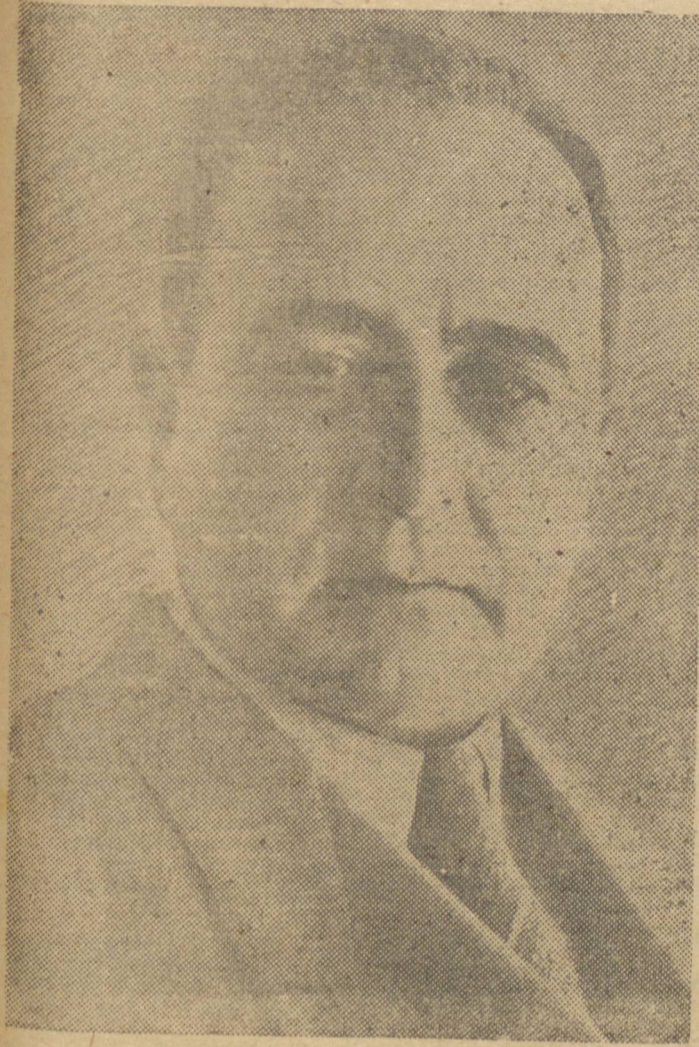
PRESIDENTE GETULIO VARGAS, O ESTADISTA QUE ATENDEU A VOZ DO SEU POVO OLE CLAMOR, NA PRAÇA PUBLICA, PELA GUERRA AO OPRESSOR BARBARO, NO SEU PROPRIO COVIL

DOCUMENTO DE VERDADEIRA EXPRESSÃO AMERICANISTA E DEMOCRÁTICA O DISCURSO DO SR. VARGAS