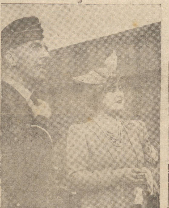
A RAINHA ELISABETH VISITA UMA BASE DE BOMBARDEIROS DA RAF.