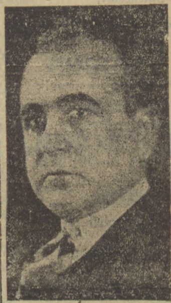
Presidente GETULIO VARGAS

RIO, 17 (D) — Telegrammas de Porto Alegre informam que a Varig poz um de seus melhores apparelhos á disposição do presidente Ge-