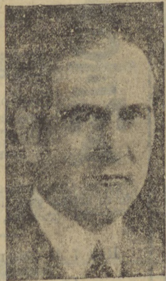
Embaixador Oswaldo Aranha