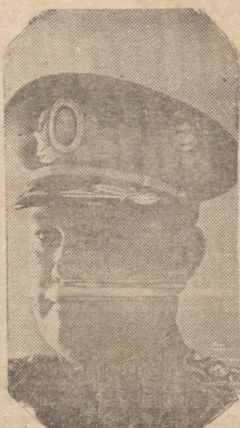
1916 foi promovido a 2º Tenente, saindo 1º Tenente a 22 de Fevereiro de 1921. Capitão a 14 de Julho de 1927 foi em 1933, 1937 e 1940, respectivamente, promovido, por merecimento, a Major, Tenente-Coronel e Coronel.

cedentes ocupado postos de relevancia no Exército Nacional, nasceu a 23 de Agosto de 1894. Verificou praça a 9 de Março de 1912, sendo declarado aspirante a 2 de Janeiro de 1915. Em 2 de Agosto de