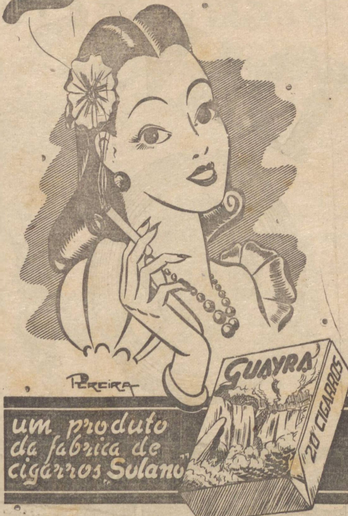
um produto da fabrica de cigarros Sulano