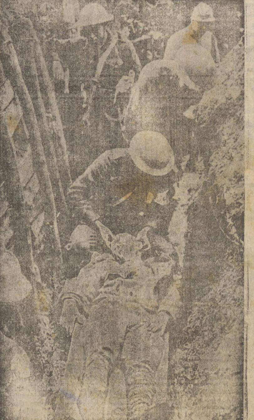
CENA DA GUERRA — Um soldado polaco ferido é socorrido dentro de uma trincheira aberta nos arredores de Varsovia

CURITIBA, 16 (Sucursal, pelo telefone) — O "Aeroloide Iguaçu" continuará funcionando, segundo decisão tomada hoje em Assembléa Geral.