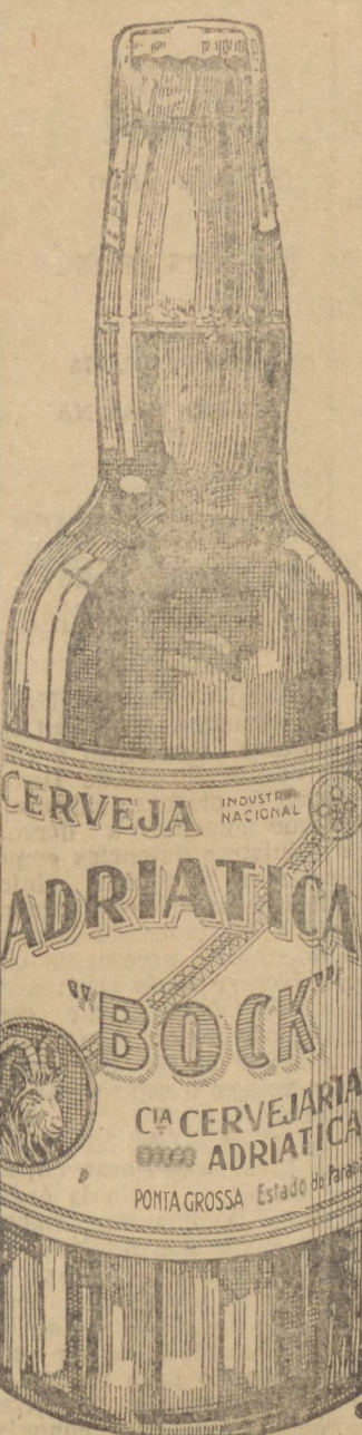
Adriatic-Bock Clara e escura